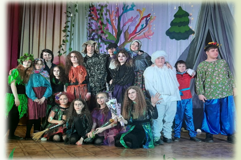
Генеральная репетиция спектакля «Маленькая Баба-Яга»