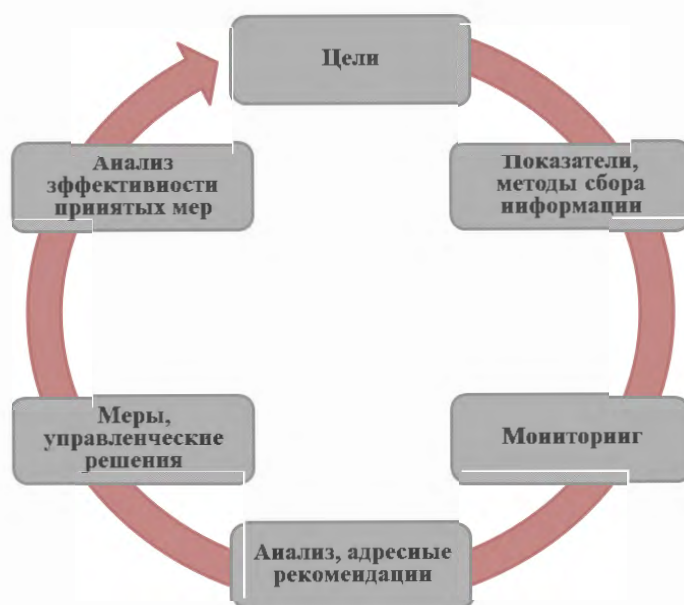
Рисунок 3 – Структура управленческого цикла

Реализация первых двух компонентов возможна через разработку регионами концептуальных документов (программ). Последующие четыре компонента реализуются через принятые регионами подходы (действия).