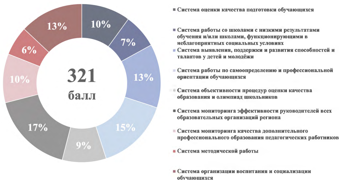
Рисунок 2 – Структура итогового балла

1.8. Максимальный итоговый балл по результатам проведения оценки составляет 321 балл. Структура итогового балла представлена на рисунке 2.