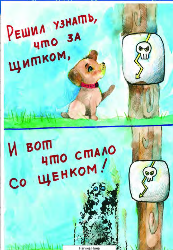
Нагина Нина с. Томское «Щиток и щенок»

Первое, что нужно сделать при поражении человека током – это устранить его источник, при этом обеспечив собственную безопасность. Если дыхание и пульс отсутствуют, сделайте искусственное дыхание. Если дыхание есть, но нет сознания, нужно перевернуть пострадавшего на бок и вызвать скорую помощь. На ладонях человека, который прикоснулся к проводу, остаются электрические ожоги - их всегда два - место входа и выхода. Место ожога нужно охладить под холодной водой в течение не менее 15 минут, затем наложить чистую тканевую повязку. Обрабатывать антисептиком ожоги не нужно!